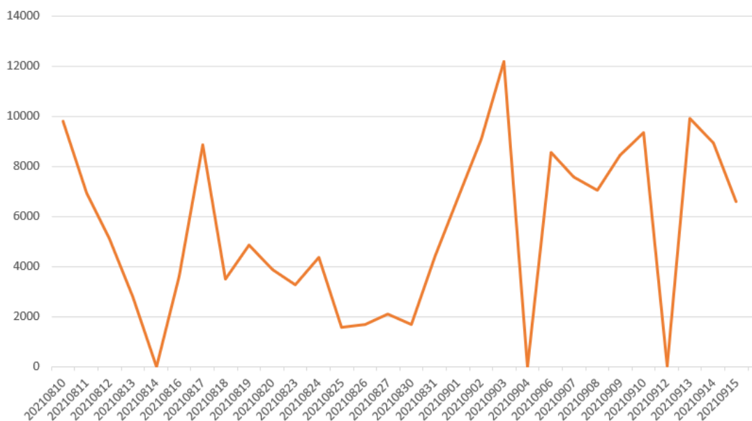
Actividad de los usuarios