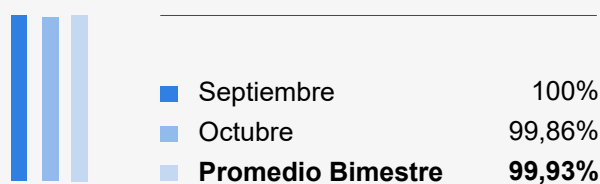
Disponibilidad global de los servicios (*)